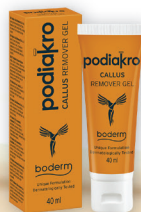
PODIAKRO CALLUS REMOVER GEL 40ml