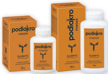
PODIAKRO POWDER 50g & 100g