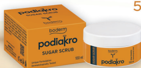
PODIAKRO SUGAR SCRUB 100ml