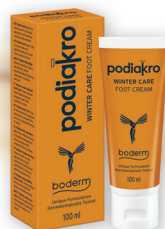
PODIAKRO WINTER CARE FOOT CREAM 100ml