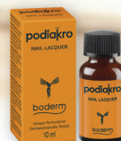
PODIAKRO NAIL LACQUER 10ml